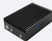
Available 220V System Benchtop Amplifier